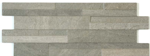
16 x 40 cm (6 x 16) Décor Muretto OL.ES.TPE.0616.MURDC