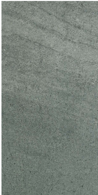
30 x 60 cm (12 x 24) OL.ES.ANT.1224.MT