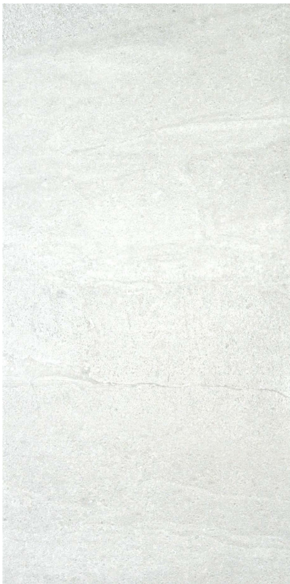
45 x 90 cm (18 x 36) (Rectifié) OL.ES.BIA.1836.MT

Tous les items présentés dans ce document font partie du programme d'inventaire Olympia. Pour les commandes spéciales, veuillez contacter votre représentant de Tuiles Olympia.