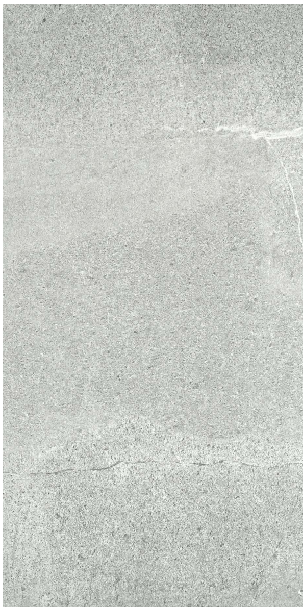
45 x 90 cm (18 x 36) (Rectifié) OL.ES.GRG.1836.MT

Tous les items présentés dans ce document font partie du programme d'inventaire Olympia. Pour les commandes spéciales, veuillez contacter votre représentant de Tuiles Olympia.