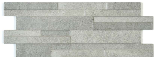
16 x 40 cm (6 x 16) Décor Muretto OL.ES.GRG.0616.MURDC