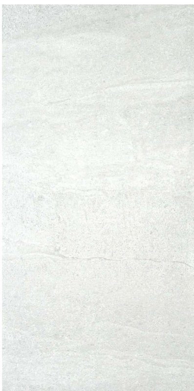
30 x 60 cm (12 x 24) OL.ES.BIA.1224.MT