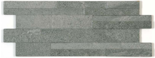
16 x 40 cm (6 x 16) Décor Muretto OL.ES.ANT.0616.MURDC