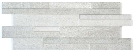
16 x 40 cm (6 x 16) Décor Muretto OL.ES.BIA.0616.MURDC