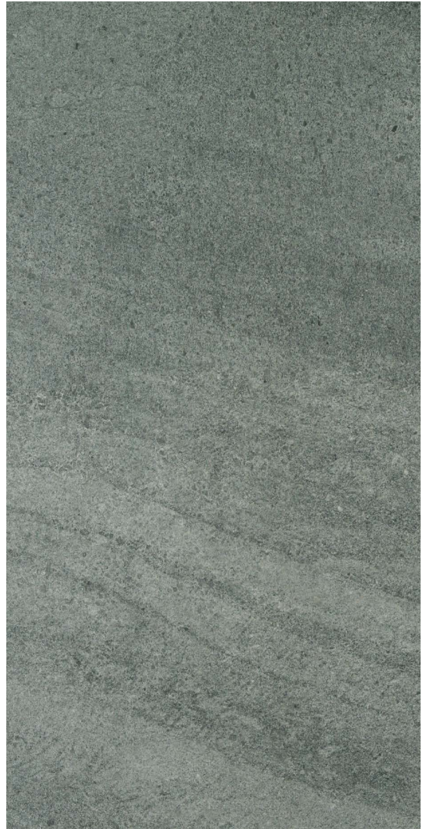
45 x 90 cm (18 x 36) (Rectifié) OL.ES.ANT.1836.MT

Tous les items présentés dans ce document font partie du programme d'inventaire Olympia. Pour les commandes spéciales, veuillez contacter votre représentant de Tuiles Olympia.