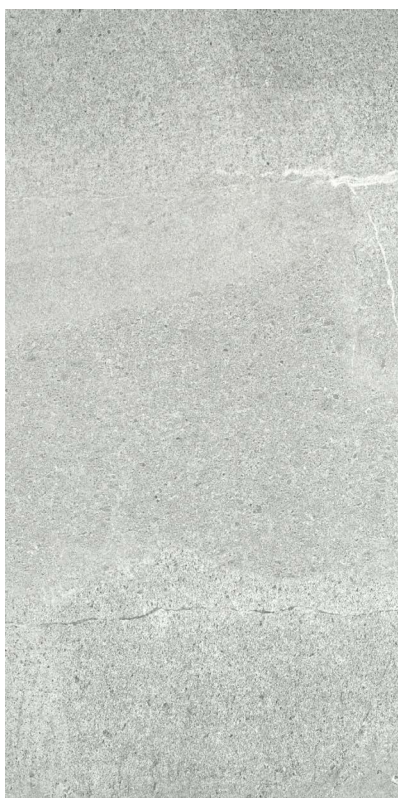
30 x 60 cm (12 x 24) OL.ES.GRG.1224.MT