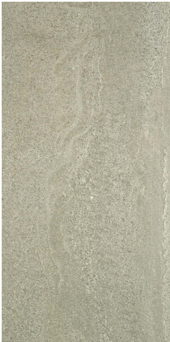
45 x 90 cm (18 x 36) (Rectifié) OL.ES.TPE.1836.MT

Tous les items présentés dans ce document font partie du programme d'inventaire Olympia. Pour les commandes spéciales, veuillez contacter votre représentant de Tuiles Olympia.