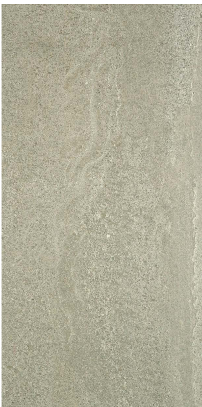
30 x 60 cm (12 x 24) OL.ES.TPE.1224.MT